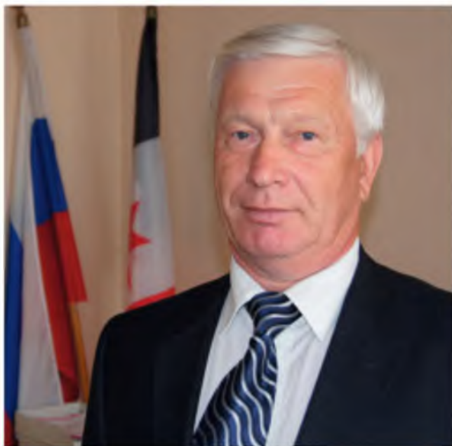
Начальник Управления по обеспечению деятельности мировых судей Удмуртской Республики при Правительстве Удмуртской Республики (2005–2012 гг.)

– Необходимо было решать вопрос о структуре управления, штатной численности, разработать